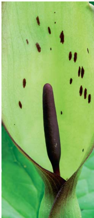
I6 - Roclenge-sur-Geer