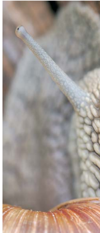
I3 - Kanne