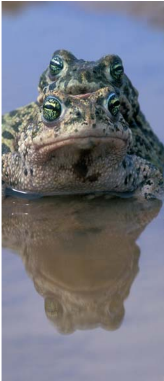
I1 - Sint-Pieter