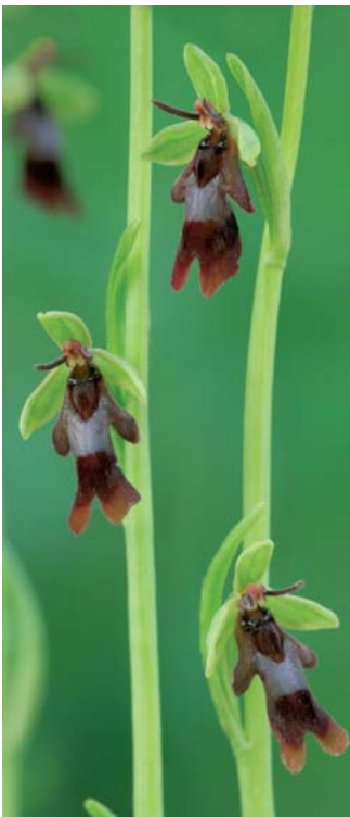
I5 - Eben-Emael