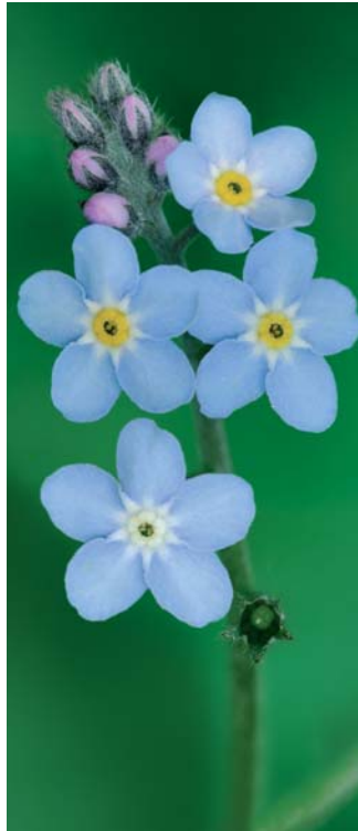
I2 - Eijsden